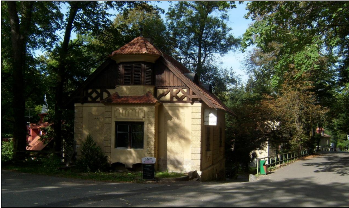
Konopiště čp. 4 – zde se roku 1793 narodil Václav Hanibal. Domek se nachází u hráze rybníka pod zámekem.

Snad si v panské službě dosti vydělal nebo nějaký majetek vyženil či zdědil, protože již roku 1795 kupuje v dražbě zanedbanou usedlost v Příbyšicích čp. 12 po Janu Starostovi za 715 zlatých rýnských. Tento grunt patřil k pěti nejstarším ve vsi a připomínal se již roku 1500. Podle původních majitelů se mu říkalo Hockovský.